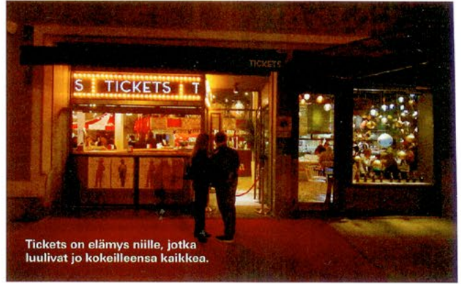
Tickets on elämys niille, jotka luulivat jo kokoilleensa kaikkea.